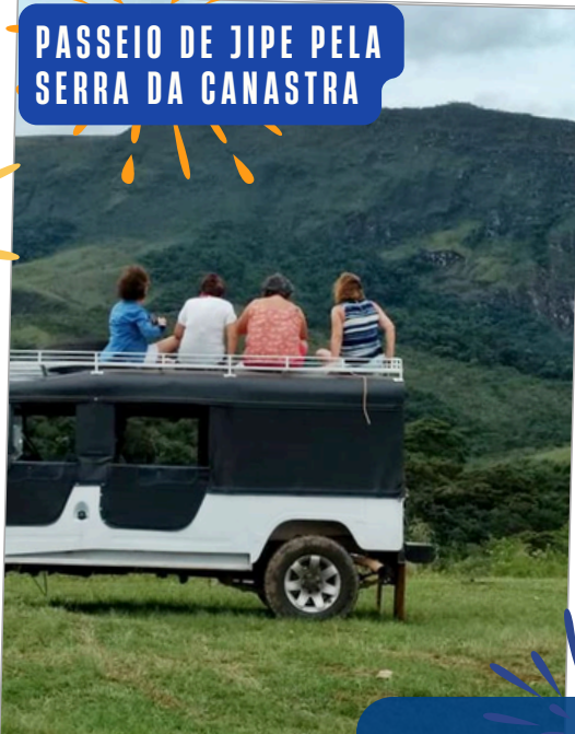
PASSEIO DE JIPE PELA SERRA DA CANASTRA