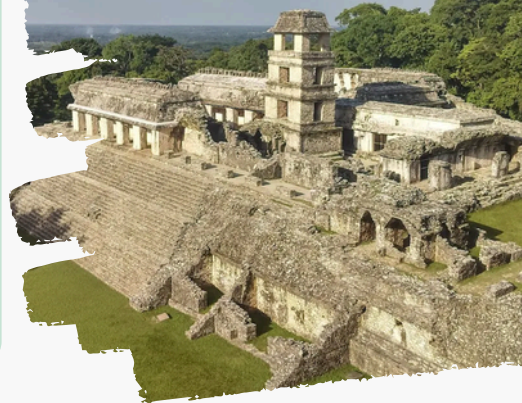
PALENQUE (ZONA ARQUEOLÓGICA)

Após o café da manhã , visitaremos o sítio arqueológico de Palenque. A grandiosidade de suas construções e a inestimável combinação da pedra branca com o verde esmeralda da selva ficam gravadas em nossa memória. Apreciaremos o Templo das Inscrições, o Palácio, os Templos do Sol e da Cruz Foliada e o Banho da Rainha no riacho Otulum. Tempo para almoço (não incluído). Saída em direção a Campeche, cidade fortificada e Patrimônio Cultural da Humanidade, onde realizaremos visita panorâmica. Hospedagem e noite livre.