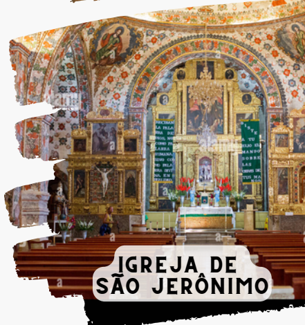
IGREJA DE SÃO JERÔNIMO