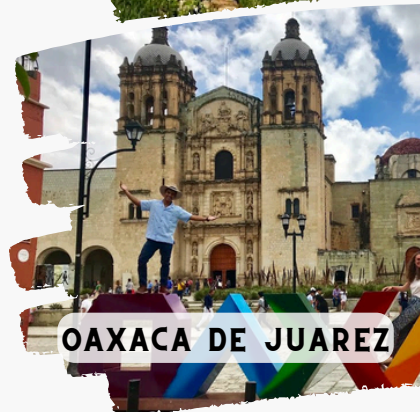
OAXACA DE JUAREZ