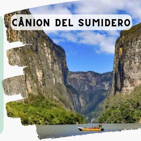
CÂNION DEL SUMIDERO

Após o café da manhã , faremos um passeio de lancha pelo impressionante Cãnion do Sumidero, com cerca de mil metros de altura em seu ponto máximo. Tempo para Almoço (não incluído). Breve visita a Chiapa de Corzo, cidade que reúne memória colonial e sítio arqueológico pré-Colombiano, no caminho para San Cristóbal. Hospedagem em San Cristóbal (nosso guia fará um breve passeio de reconhecimento nos arredores e informará as opções de gastronomia)