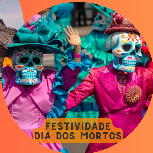
FESTIVIDADE DIA DOS MORTOS