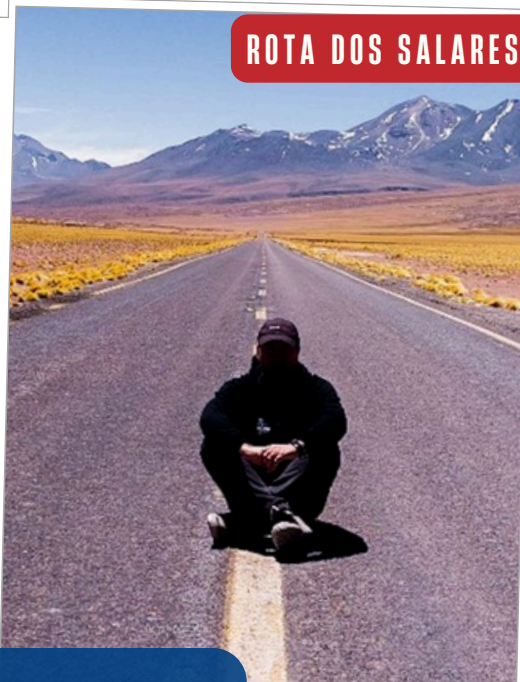
ROTA DOS SALARES