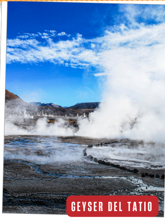
GEYSER DEL TATIO