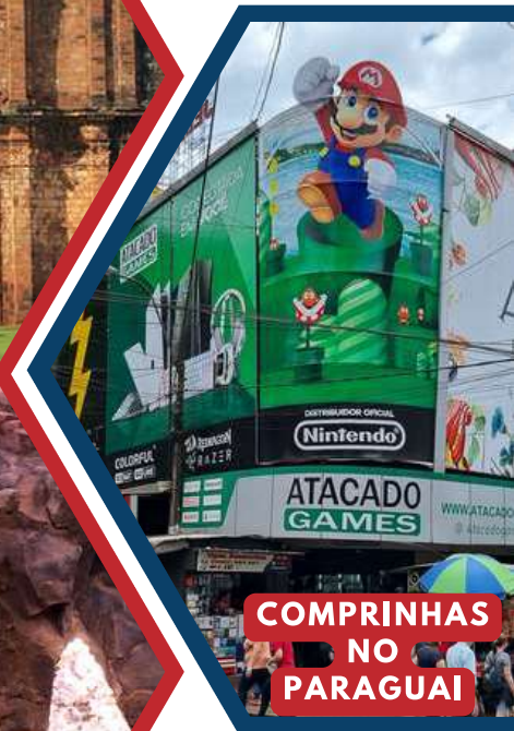
COMPRINHAS NO PARAGUAI