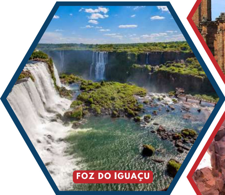
FOZ DO IGUAÇU