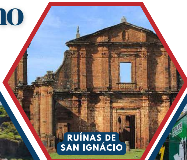
RUÍNAS DE SAN IGNÁCIO